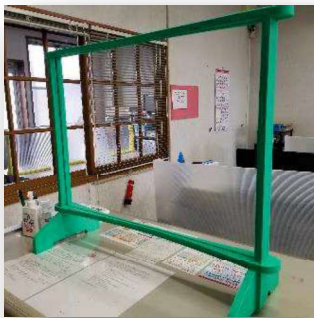
▲Round table type S (パネルサイズ：W650×H480)

※上記はLong table type (パネルサイズ：W1700×H800) となります。 色はオレンジ、ミドリで選べます。